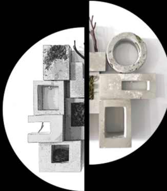
SASINUN KLADPETCH invasion non-mexican version