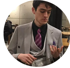
ESCRITO POR: @prestre_juan